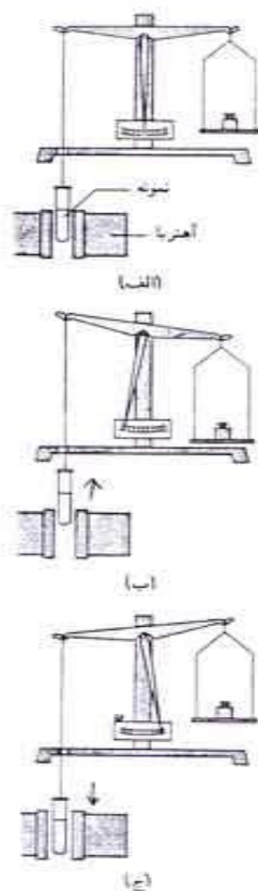
شکل: تعیین خواص مغناطیسی (الف) ماده در غیاب میدان مغناطیسی توزین می‌شود (میدان خاموش است). (ب)

می‌کنند و تا آن تراز نیم‌پر نشود، الکترونها در هیچ یک از آن اوربیتالها جفت نمی‌شوند.